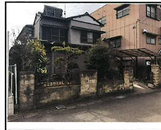
※この物件資料は概要の紹介図です。形状など現場と異なる場合は現状を優先下さい。