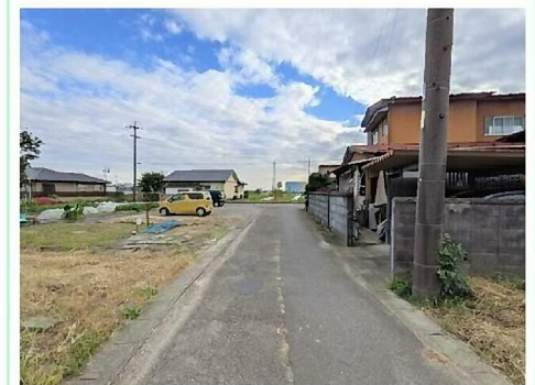
東側道路を北から撮影

※この図面は物件情報の一部を抜粋して掲載しております。(現況優先) ※付帯条件や別途料金が発生する場合がありますのでご確認ください。