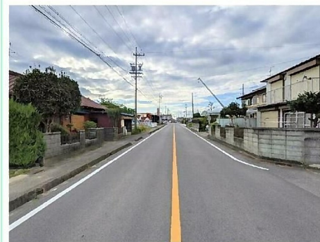
南側道路を東から撮影